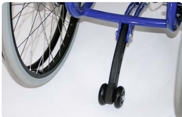
Tipsikring/vippehjælp Tip stop/ tipping aid