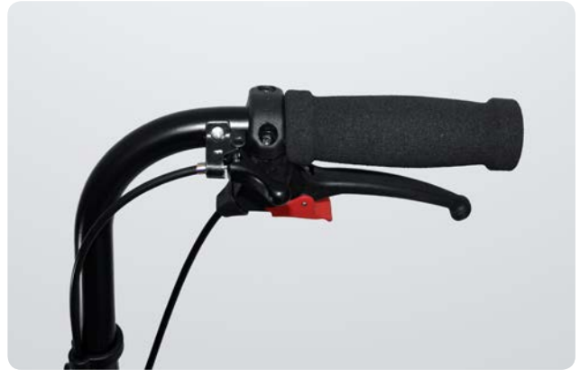
Enkelte skubbehåndtag (valgfri) Single pushing bars (optional)