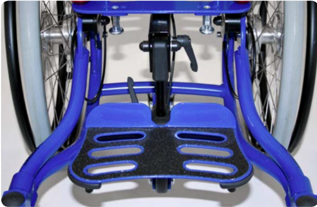
Abduceret ramme / Fodpladesystem Abductor frame / Footrest system