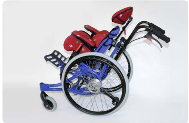
MINY med MAGICLIGHT i vippeposition MINY with MAGICLIGHT in tilted position

MINY® is the smallest commercially available undercarriage. It can be combined with standardised or tailored seating systems or with an anatomically moulded seat back unit, to function as an active wheelchair. The frame can be easily abducted and permits an optimal sitting position. The back rest can be easily folded, so that the frame can be fitted into even small cars, such as a MINY®.